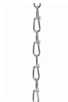
Kedja 30 m

Armaturen uppfyller de grundläggande kraven i tillämpliga EU-direktiv och produktsäkerhetslagen och är CE-märkt. Kontakta din rådgivare vid användning av armaturen i kemiskt förorenade omgivande atmosfärer, under ökade omgivningstemperaturer eller hög eller kondenserande luftfuktighet.