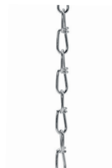
Knotenkette 30 m

Die Leuchte erfüllt die grundlegenden Anforderungen der anwendbaren EU-Richtlinien und des Produktsicherheitsgesetzes und trägt die CE-Kennzeichnung. Bei Anwendung der Leuchte in chemisch belasteten Umgebungsatmosphären, unter erhöhten Umgebungstemperaturen oder hoher bzw. kondensierender Luftfeuchtigkeit halten Sie bitte Rücksprache mit Ihrem Berater.